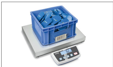
Comptage de pièces

Modèle au succès jamais démenti avec afficheur étanche à l'eau et à la poussière